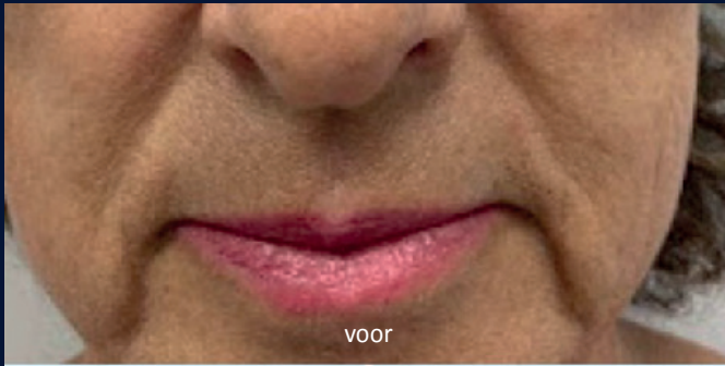
Neus en mondpleoien